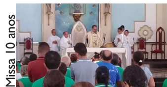
Missa 10 anos